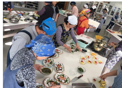
調理の様子（メイトム宗像にて）