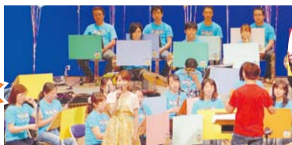
演奏:九州管楽合奏団

<演奏予定曲目> はらぺこあおむし アナと雪の女王 アンパンマンのマーチ 他 ※曲目は変更になる場合があります。 ご了承ください。