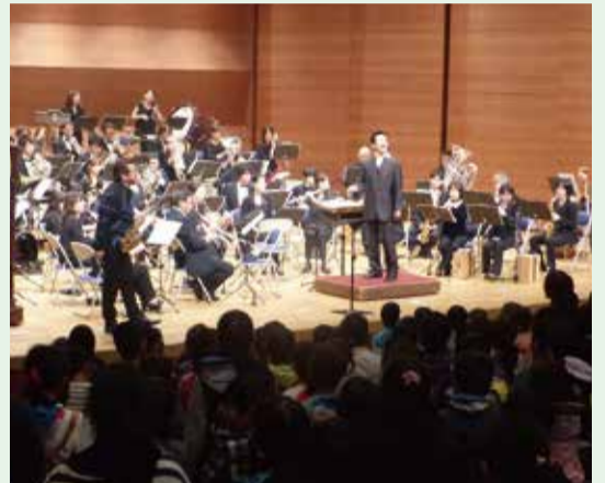
「ピリッブ」もみんな元気よく歌いました。 指揮・時任康文、ゲスト・サクソフォン奏者 オリタノボッタ

11月7日、市内全小学校の4年生が、宗像ユリックス ハーモニーホールで九州管楽合奏団演奏会を鑑賞しました。このコンサートは宗像市文化芸術のまちづくり10年ビジョンの重点プロジェクトとして行なわれたもので、子どもたちに本物の芸術に触れる機会を創出する企画です。コンサートをより楽しんでいただくために、10月下旬から楽団員が小学校を訪問し、楽器の特徴、コンサートでの楽しみ方とマナーなどを事前にレクチャーしました。柔らかな感性をもつ子どもたちの笑顔がとても印象的なコンサートでした。