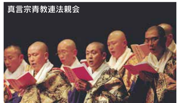
真言宗青教連法親会

<プロフィール> ミラノ大聖堂聖歌隊は、大人20名と子ども35名で編成されている聖歌隊であり、ミラノで最も古い文化団体である。日頃から過密スケジュールで活動を精力的に行っており、毎週日曜日のミラノ大聖堂のミサ、数多くの公的文化行事、宗教行事に参加している。その実力、地位は高く評価され、それ以外に、イタリア国内各地での演奏活動や重要な国際音楽祭での演奏活動を行っている。2014年の来日公演は大人のみの編成。