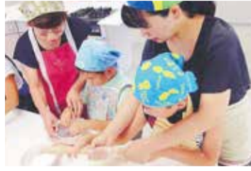
写真は前回のピザ作りの様子