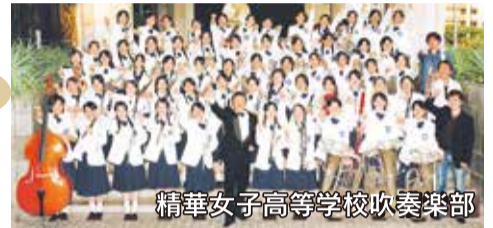
精華女子高等学校吹奏楽部