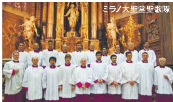
ミラノ大聖堂聖歌隊

<プロフィール> ミラノ大聖堂聖歌隊は、大人20名と子ども35名で編成されている聖歌隊であり、ミラノで最も古い文化団体である。日頃から過密スケジュールで活動を精力的に行っており、毎週日曜日のミラノ大聖堂のミサ、数多くの公的文化行事、宗教行事に参加している。その実力、地位は高く評価され、それ以外に、イタリア国内各地での演奏活動や重要な国際音楽祭での演奏活動を行っている。2014年の来日公演は大人のみの編成。