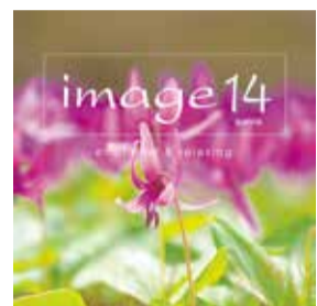
発売元:ソニー・ミュージックジャパンインターナショナル

星空の下でゆっくりと美しい音楽を楽しむ リラクゼーションプログラム。 コンピレーションアルバム「image(イメージ)14」より 星空にとけこむ美しい楽曲をお届けします。 心やすらぐひとときをお楽しみください。