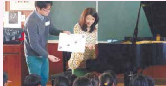
「ぞうさん」を逆さまにして皆で歌ってみる どんな「ぞうさん」になるかな?

プレイガイド紹介 【一部例外や売り切れなどもあります】 ●ローソンチケット TEL0570(084)008【Lコード参照 ※PHS・一部携帯電話からの利用不可】またはローソン各店 ●チケットぴあ TEL0570(02)9999【Pコード参照】またはぴあステーション、セブンイレブン各店 ユリックスプレイガイド【●うどう書店 ●井原書店 ●サンリブくりえいと宗像 ●ゆめタウン宗像 ●赤間コミセン ●赤間西コミセン ●自由ヶ丘コミセン ●東郷コミセン ●岡垣サンリーアイ】 託児あり 託児サービス(有料)がある公演です(公演によって定員があります) 各公演日の1週間前までに、宗像ユリックス窓口または、電話でお申し込みください。【事業部 TEL0940(37)1483】 対象:生後6カ月~小学校低学年 料金:1公演1人1,000円(ユリックス倶楽部会員は無料) 臨時バスあり(有料) 送迎バスがある公演です。所要約5分 JR東郷駅日の里口から宗像ユリックス間を運行。時間はお問い合わせください。