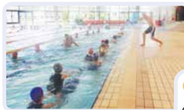
水中ウォークのレッスン風景