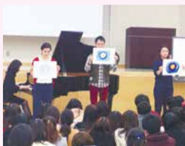
同じ音楽を聴いてもさまざまなイメージを受け取ることを体験