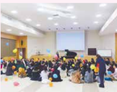
ピアノが出す音の振動を風船を使って体感