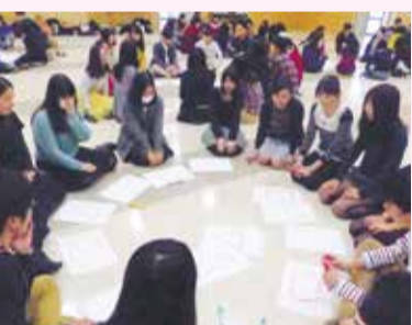
○(まる)・△(さんかく)・□(しかく)を使って音楽を作ってみる