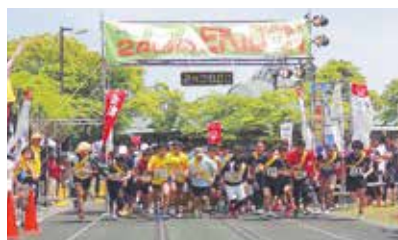
大会スタートの様子