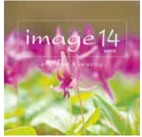
発売元:ソニー・ミュージックジャパンインターナショナル

~image(イマージュ)を聴きながら~ 星空の下でゆっくりと美しい音楽を楽しむ リラクゼーションプログラム。 コンピレーションアルバム「image(イマージュ)14」より 星空にどけこみ美しい楽曲をお届けします。 心やすらぐひとときをお楽しみください。