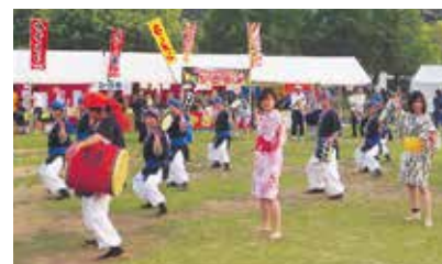
ギャラリーも楽しめるサブイベントを用意しています。