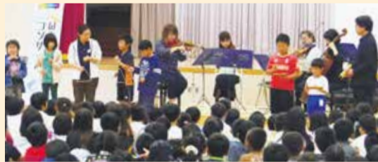
【5/10公演】 日の里東小学校 九州交響楽団 弦楽メンバー