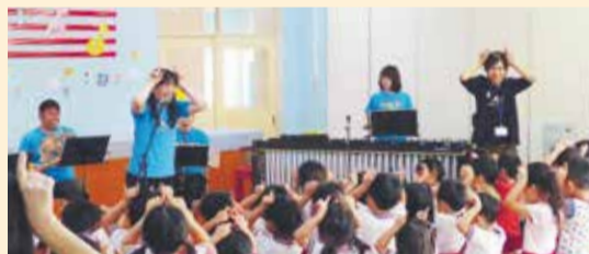
【6/14公演】 恵愛保育園 九州管楽合奏団 木管・打楽器五重奏

【オフィシャルサポーター】 ○グローバルアリーナ ○道の駅むなかた ○宗像歯科医師会 ○別格本山鎮国寺 ○宗像観光協会