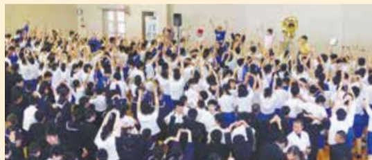
【5/11公演】 城山中学校 ブラック ボトム プラス バンド