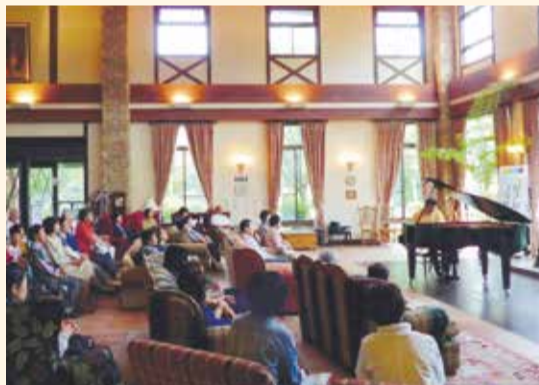
2015年いきいき出前コンサートの様子(グローバルアリーナ)

産業革命と共に完成した現代のピアノを演奏、鑑賞することで近代化を追体験し、今を生きる身としての