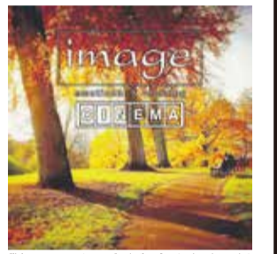
発売元:ソニー・ミュージックジャパンインターナショナル

~image(イメージ)を聴きながら~ 星空の下でゆっくりと美しい音楽を楽しむ リラクゼーションプログラム。 コンピレーションアルバム「image-CINEMA-(イメージ・シネマ)」より 星空にどけこむ美しい楽曲をお届けします。 心やすらぐひとときをお楽しみください。