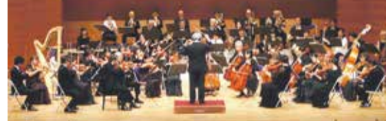
演奏:宗像フィルハーモニー管弦楽団

主催:宗像フィルハーモニー管弦楽団、宗像ユリックス ●お問い合わせ・チケット予約は 宗像ユリックス 事業部 TEL0940(37)1483