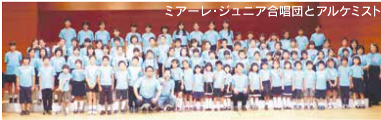
ミアレ・ジュニア合唱団とアルケミスト