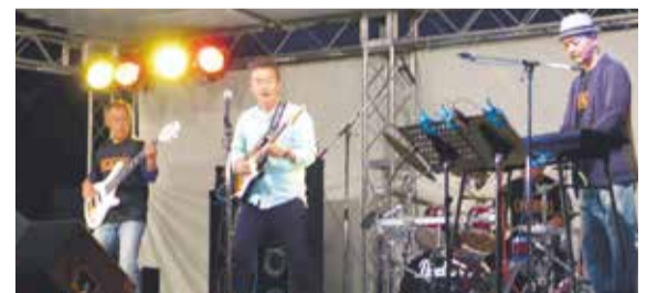
<古墳広場ステージ>