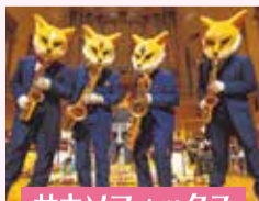
サキシフォックス