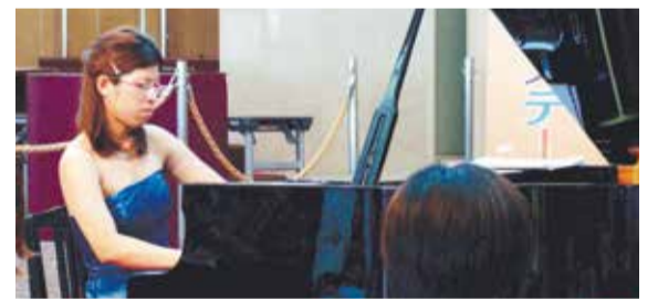
<ホワイエステージ>