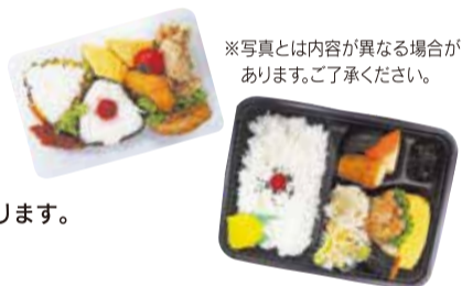
※写真とは内容が異なる場合があります。ご了承ください。