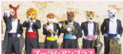
ズーラシアンブラス