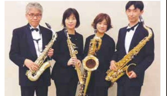
出演:九州管楽合奏団 (サクソフォン四重奏)

入場無料 ★申し込み不要。会場が満席になった場合はご入場できない場合がございます。あらかじめご了承ください。