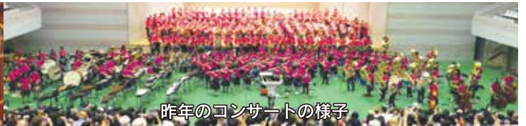
今年のコンサートの様子