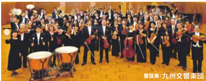
管弦楽:九州交響楽団

夏の名物公演「わくわく・ドキドキ♥オーケストラ体験!!」がパワーアップして冬にも登場！クラシックコンサートが初めてのお子さまでも楽しめる、華やかな曲がたくさんそろいました。 魅力がたくさんつまった1日、ぜひご家族でお楽しみください！