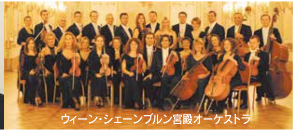
ウィーン・シェーンブルン宮殿オーケストラ