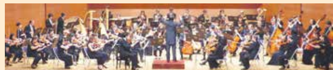
管弦楽 九州交響楽団

主催: 宗像市、宗像ユリックス、cross fm 音楽監督: 今村 晃(九州交響楽団アドバイザー)