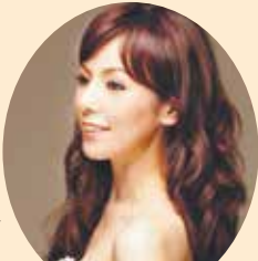
ソプラノ: 森 麻季

<10/7(土)> ソリスト: 森 麻季 世界を代表するオペラ歌手が名曲の数々を歌いあげます!