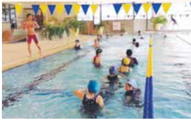
※写真は水中運動クラスの様子

知的障がいのある人が対象のクラスや音楽に合わせて運動するアクアビクスなどを設けております。