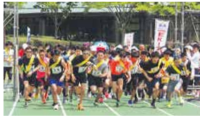
大会スタート直後の様子