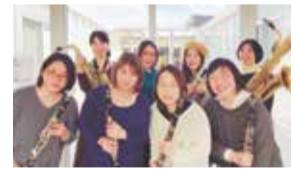
〈出演者〉ママ&キッズベリーバンド

※鑑賞料は無料ですが、レストランのランチご利用のお客さまに限りです。鑑賞のみのご来場はご遠慮ください。