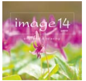
発売元:ソニー・ミュージックジャパンインターナショナル

星空の下でゆっくりと美しい音楽を楽しむ リラクセーションプログラム。 コンピレーションアルバム「image(イマージュ)14」より 星空にだけこむ美しい楽曲をお届けします。 心やすらぐひとときをお楽しみください。 ~内容が新しくなりました~