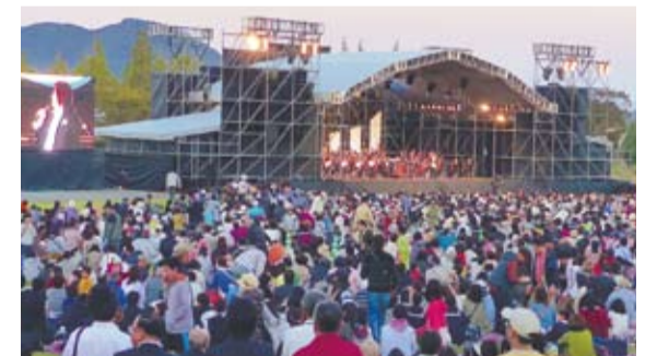
●昨年の野外コンサート(※今年は野外ステージはありません)

《昨年の宗像ミアーレ音楽祭》入場者数 コンサート(野外・ホール) 9,232人 市民ステージ 2,175人 楽器体験イベント 4,000人 いきいき出前コンサート 8,542人(56カ所) 合計 23,949人