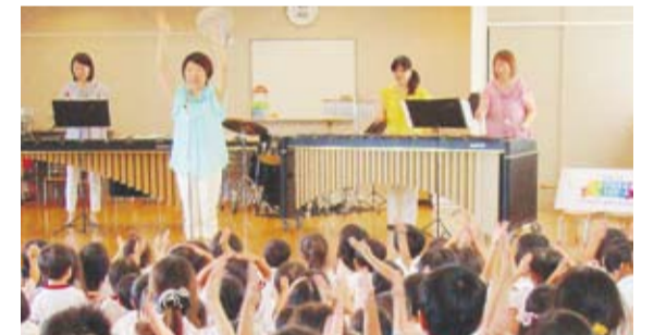
●いきいき出前コンサート