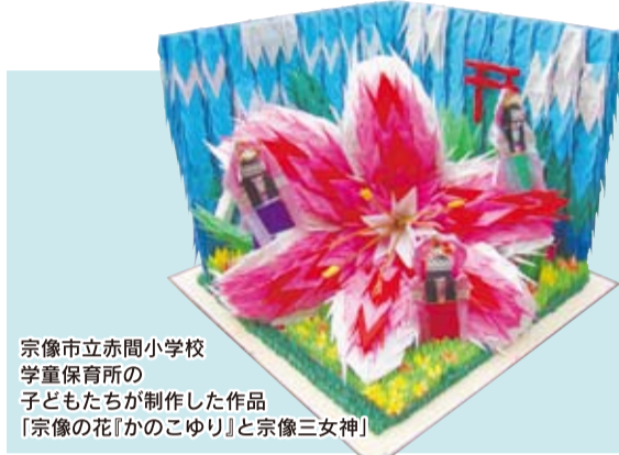
宗像市立赤間小学校 学童保育所の 子どもたちが制作した作品 「宗像の花『かのごゆり』と宗像三女神」

東京・渋谷にある「こどもの城」主催、「おりがみカーニバル・全国児童館おりがみ作品巡回展」が今年も宗像ユリックスにやってきます。ひとつのテーマ「私たちの自然」から、全国の子どもたちがさまざまな発想で作品を制作。