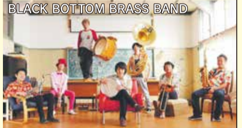
BLACK BOTTOM BRASS BAND

<ブラック・ボトム・ブラス・バンド> 日本唯一のニューオーリンズスタイルブラスバンド。JRAやユニクロのCM曲や、TV、映画に多数の楽曲提供している。音楽の楽しさをストレートに伝えるブラスワークショップや音楽教室は大好評。全国各地で活躍中。