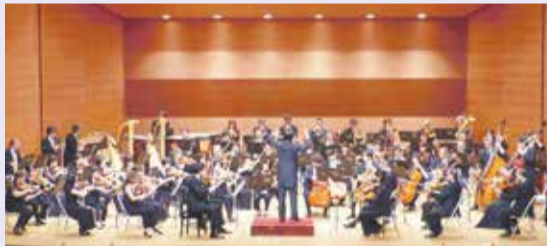
管弦楽:九州交響楽団