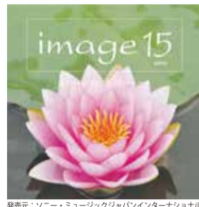
発売元:ソニー・ミュージックジャパンインターナショナル

星空の下でゆっくりと美しい音楽を楽しむ リラクセーションプログラム。 コンピレーションアルバム「image(イメージ)15」より 星空にだけこむ美しい楽曲をお届けします。 心やすらぐひとときをお楽しみください。