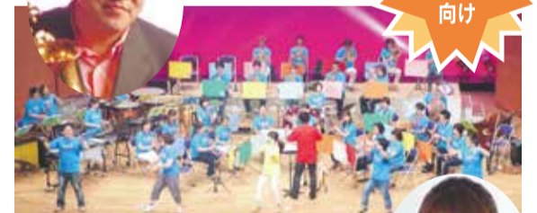
演奏:九州管楽合奏団