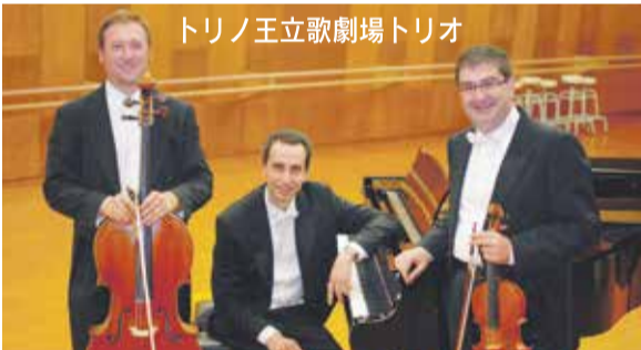
トリノ王立歌劇場トリオ