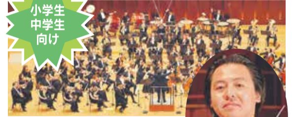
管弦楽:九州交響楽団