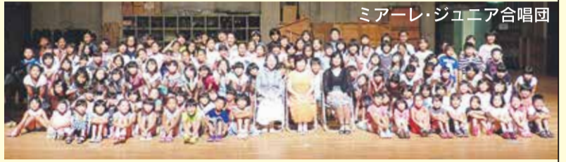
ミアーレ・ジュニア合唱団

平成26年に結成したユリックス ジュニアプラスによる元気いっぱいの演奏に、昨年に引き続き今年も新たに募った宗像ミアーレ・ジュニア合唱団、そして福岡教育大学音楽科の学生によるコンサート。魅力あふれるステージをどうぞお楽しみください!