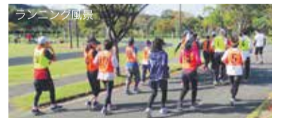
※天候によっては室内で実施します。

毎月1回実施しているアクアドームオリジナルのランニング練習会！ ランニングが初めての人や興味がある人ならどなたでも参加OK！