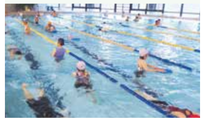
※写真は水泳・水中運動クラスの様子

25m泳げない人や水に顔をつけられない人などお気軽にご参加いただけます。基本練習を行い、25m泳げるよう指導いたします。泳ぎのコツを習得しませんか！