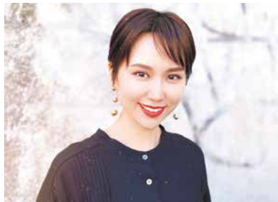
後援：宗像市、宗像市教育委員会、福津市教育委員会

情熱的なタンゴのリズムに合わせて、家族みんなで南米の国・アルゼンチンに出発しましょう！！